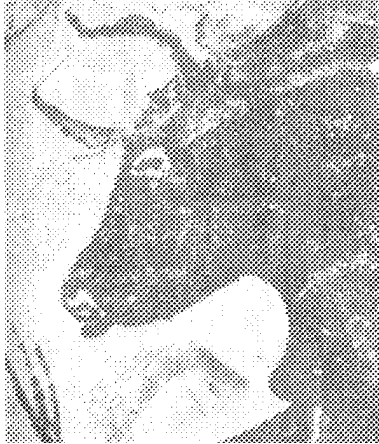
Cerfs et saumons gravés sur os découvert sur le site de Lortet (Hautes Pyrénées).