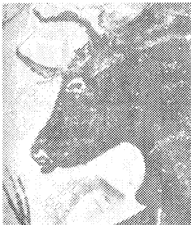
Cerfs et saumons gravés sur os découvert sur le site de Lortet (Hautes Pyrénées).