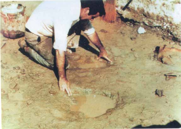
Fig.4 Empreintes d'homme et de dinosaure espacées de 45 cm (site Mc Fall I, fouilles du Dr Carl E. Baugh)

3-4- Tous les peuples possèdent dans leurs traditions et leurs mythes culturels de multiples réminiscences sur les dinosaures (dragons), signes que les peuples anciens avaient certainement eu contact avec quelques spécimens survivants. Si ces dinosaures avaient vécu 100 ou 200 millions d'années plus tôt, ils ne pourraient pas faire partie de l'imaginaire culturel, puisque les hommes auraient alors totalement ignoré leur existence 14