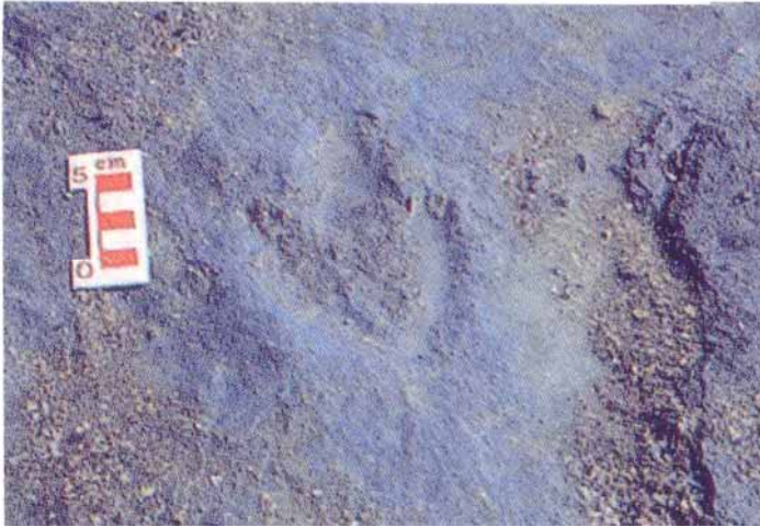
Fig. 5 Empreinte de dinosaure sur la plage de Talmont (Vendée)

A peu de distance, sur la même côte, à Longeville, et sur un site géologique analogue, ce sont des empreintes de bovins, d'ovins et de caprins que l'on a retrouvées. Comme ces traces provenaient d'un troupeau, et que ce petit bétail n'était pas encore apparu sur terre selon l'échelle chronologique d'apparition des espèces, on a gommé discrètement la référence géologique qui devait dater ce bétail à l'époque du crétacé de l'Hettangien, selon la méthode habituelle, pour dater les traces à 5.300 ans avant J-C, l'âge archéologique estimé des vestiges d'un village néolithique situé à quelques kilomètres de là ( fig. 6 ) 18 .