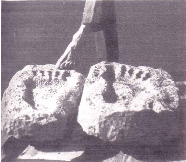
Fig. 2 Empreintes de pied humain géant.

Cette découverte, bien réelle cependant, mettait en effet en question la science paléontologique dans son interprétation évolutionniste habituelle.