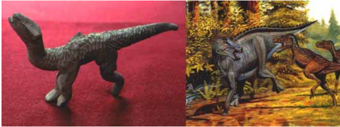
Fig. 1 Iguanodon (Figurine et représentation actuelle)

Mais Noquera s'aperçut bientôt que les figurines de dinosaures posaient un problème majeur pour sa carrière professionnelle.