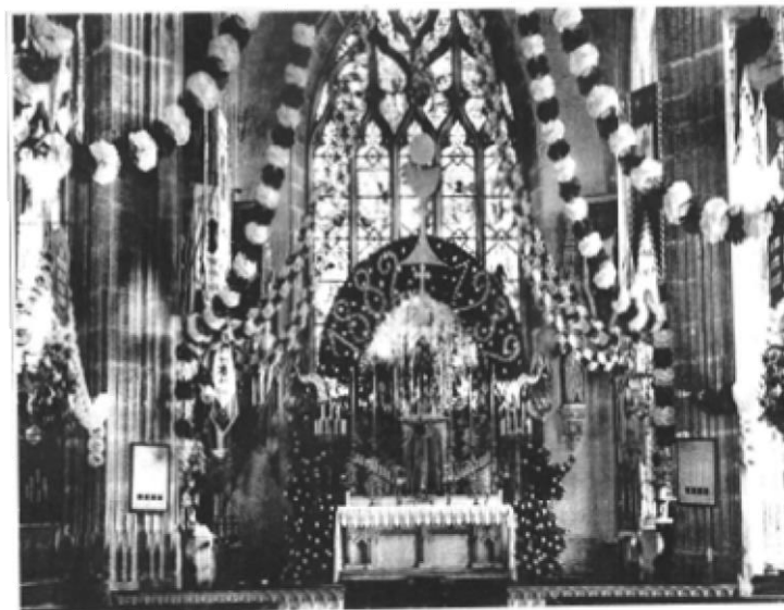
ÉGLISE DE POUZAUGES (VENDEE)