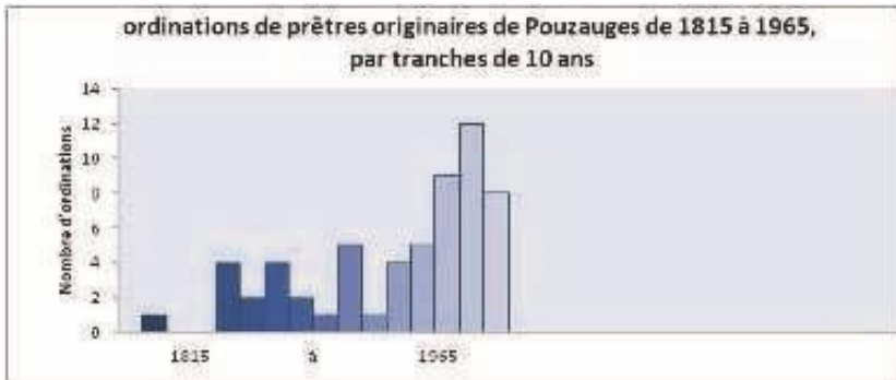
Fig. 2. Les vocations sacerdotales à Pouzauges

Sur les 59 prêtres sortis de Pouzauges entre 1845 et 1965 37 , 29 ont été ordonnés entre 1935 et 1965.