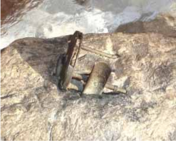
Fishing reel embedded in rock

Sachez aussi que les membres du Département de Géologie de l'Université du Tennessee, à Chattanooga, (UTC), ont examiné la roche et ont été