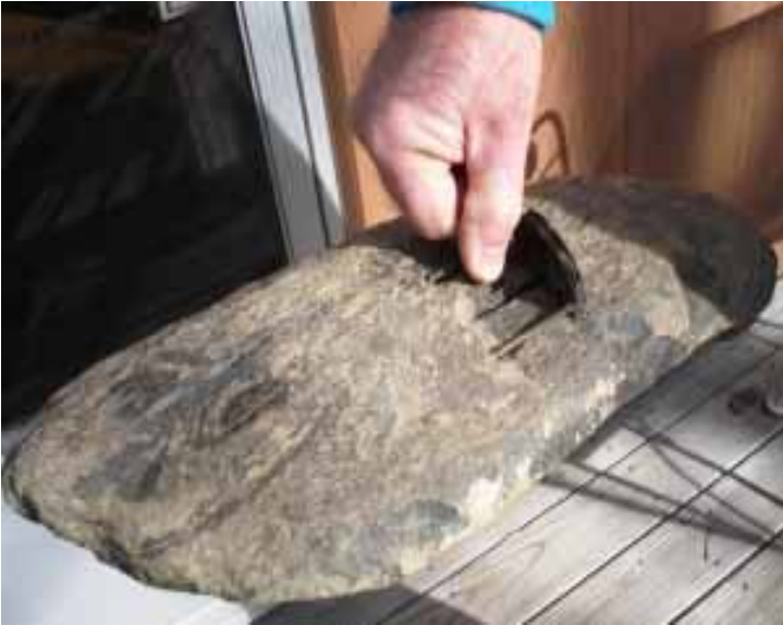
Lifting the rock using the embedded reel

Pou r que pers onne ne croi e que cette ano mali e est simp leme nt un mou linet "lég èrem